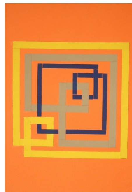
Ettore Orlandini, Tre moduli «A», 1983.

In ogni ambito si propone la discussione dei seguenti aspetti in merito al contributo delle singole attività di ambito alla preparazione per ▪ una didattica attiva, ▪ attività di laboratorio e relativa valutazione, ▪ esercizi e problemi, ▪ aggiornamento del curriculum e didattica della fisica moderna, ▪ impiego significativo di strumenti multimediali e telematici, ▪ didattica a distanza.